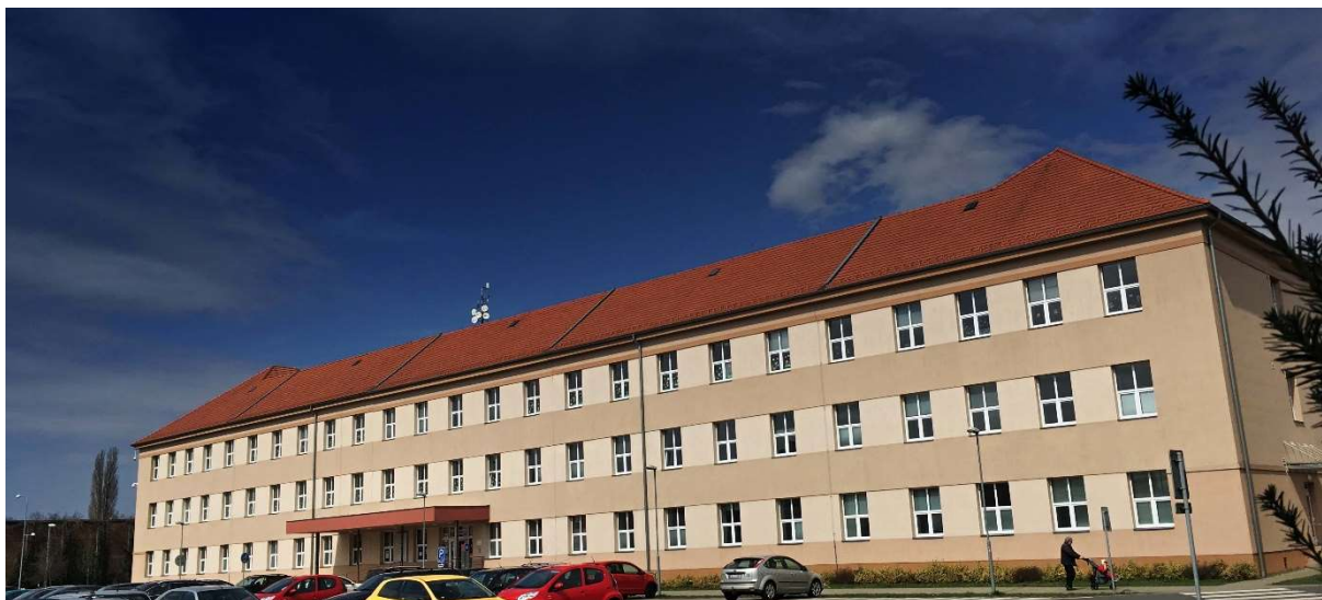
Obr. 2 – Fakulta veřejnosprávních a ekonomických studií v Uherském Hradišti

Krom těchto akademických činností je naším cílem, misí, vizí a posláním se orientovat na profesní a rekvalifikační vzdělávání, kdy jsme držiteli řady akreditací tohoto typu, a to zejména od Ministerstva školství, mládeže a tělovýchovy České republiky, Ministerstva vnitra České republiky, či Ministerstva pro místní rozvoj České republiky.