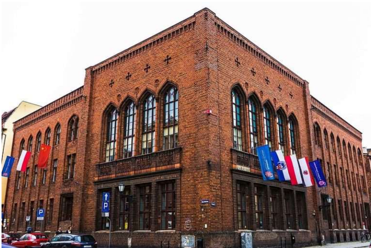
Obr. 1 Vysoká škola Jagiellońska v Toruni

Vysoká škola Jagiellońska v Toruni, pod současným názvem a programovou orientací, působí od roku 2003. Zaměřuje se na pedagogickou a tvůrčí činnost v bakalářském i magisterském studijním programu Pedagogika, a v bakalářském i magisterském studijním Správa a ekonomika. Věnuje se také realizaci profesních a manažerských studijních programů Master of Business Administration. Součástí školy je prestižní Konfucius Institut, realizovaný v partnerství s Hubei University in Wuhan (China). Člení se na dvě fakulty – Fakultu sociálních studií a Fakultu veřejnosprávních a ekonomických studií. Vysoká škola Jagiellońska sídlí v objektu, ve kterém od 18. století do současnosti probíhají nepřetržitě vysokoškolská