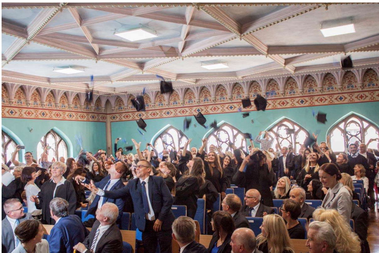
Obr. 4 – Promoce absolventů Vysoké školy Jagielloňské v Toruni